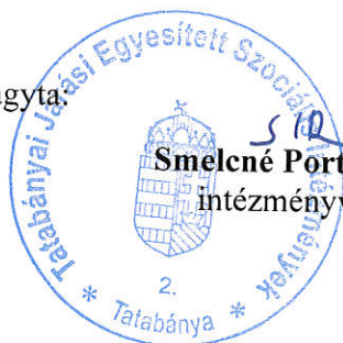
Smelcné Portik Ágnes intézményvezető