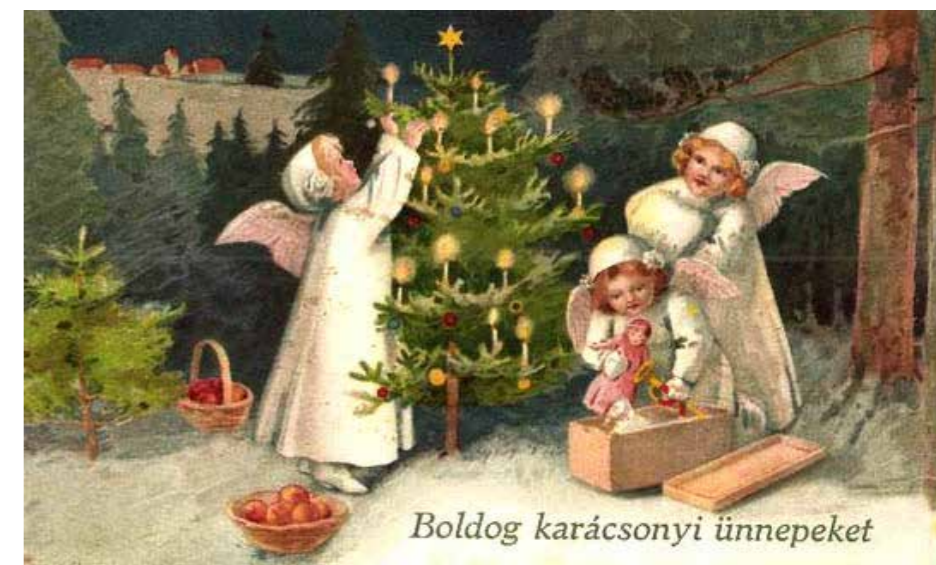
Boldog karácsonyi ünnepeket