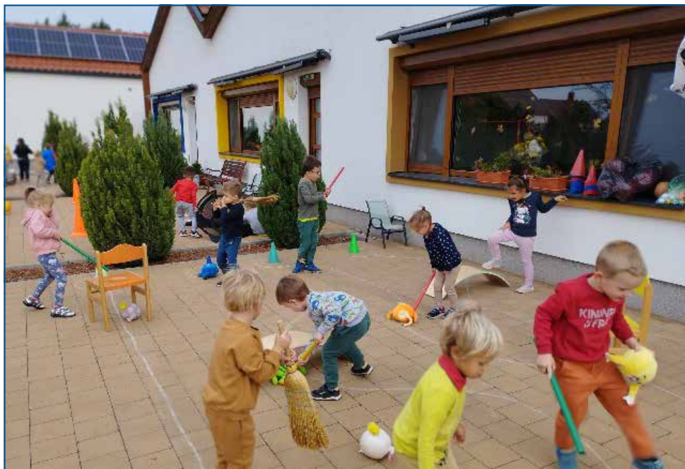
A vásár előtt megrendeztük a hagyományos Mihály-napi vigadalmat és erőpróbát.