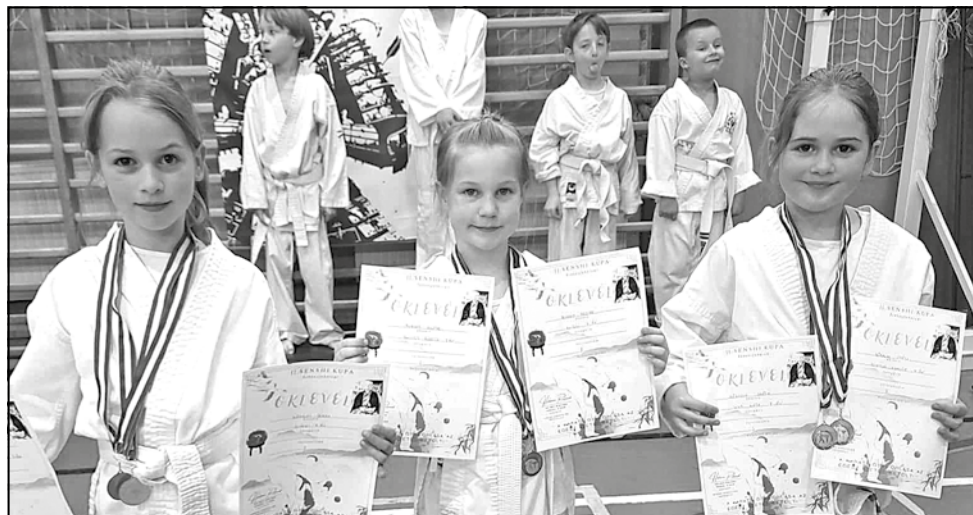
2024. június 8-án került megrendezésre a III. Koryu Samu Kupa meghívásos karate versenyünk. Az eredményekről beszámolunk a következő Hírmondóban!