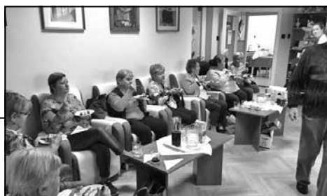
A szolgálat dolgozói

Megbecsülésünk és tiszteletünk jeléül a köszöntést követően finom süteménnyel és csokoládéval ajándékoztuk meg klubtagjainkat. Kívánunk szeretetteljes, békés időskort!