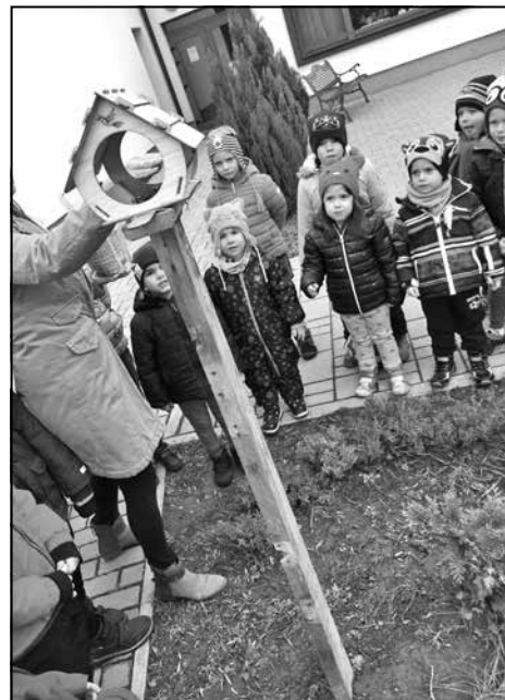
Ünnepi készülődés óvodánkban