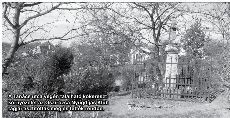
A Tanács utca végén található kőkereszt környezetét az Őszirozsa Nyugdíjas Klub tagjai tisztították meg és tették rendbe.

A ködös, nyirkos időjárás ellenére szép számban megjelenő faluszépítők egy része a község főútvonala mentén szedte össze a hulladékot, mások a falu közterületeit tisztították meg. Az összegyűjtött szemetet végül a Magyar Közút Kht. munkatársai szállították el.