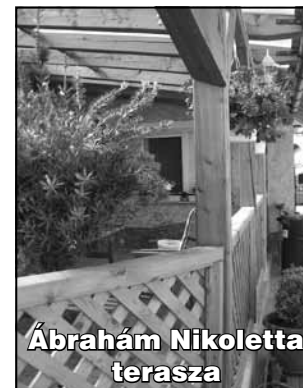
Ábrahám Nikoletta terasza