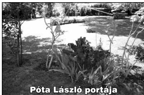
Póta László portája