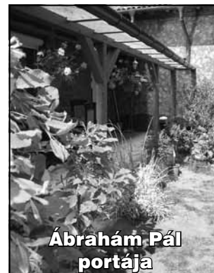
Ábrahám Pál portája